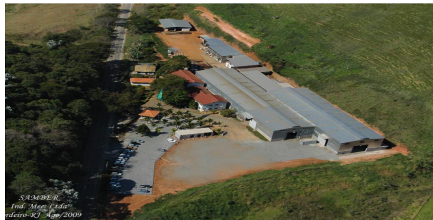
Imagem aérea da sede industrial do Grupo Sanber.

Imagens das Instalações da Sede localizada na Cidade de Cordeiro/RJ: